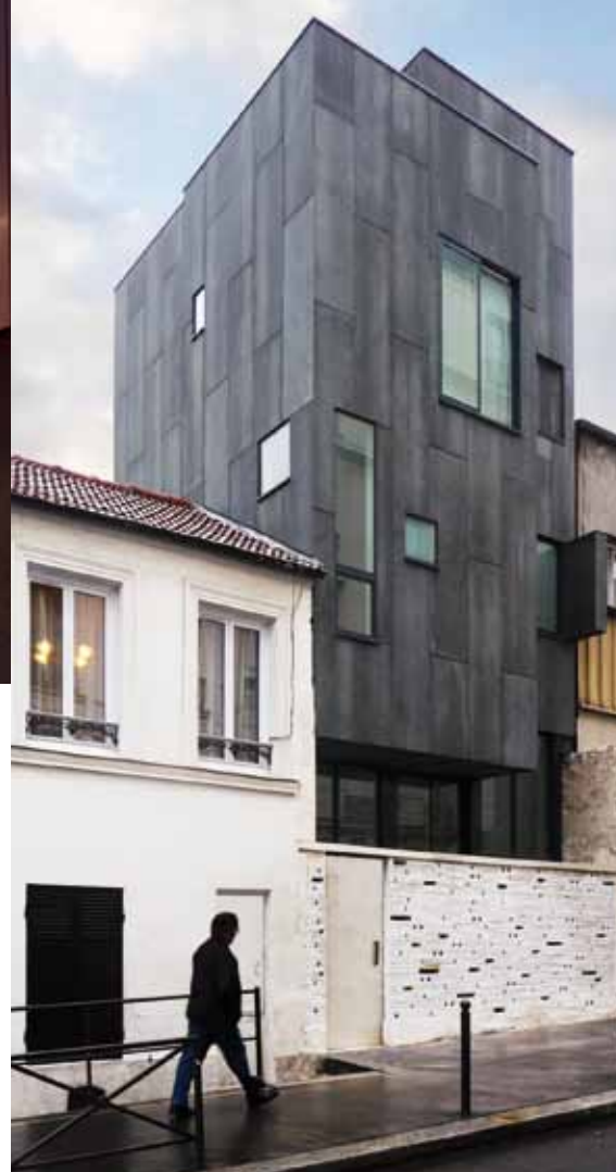
humaines-0607403578 PRIX PETITS ESPACES