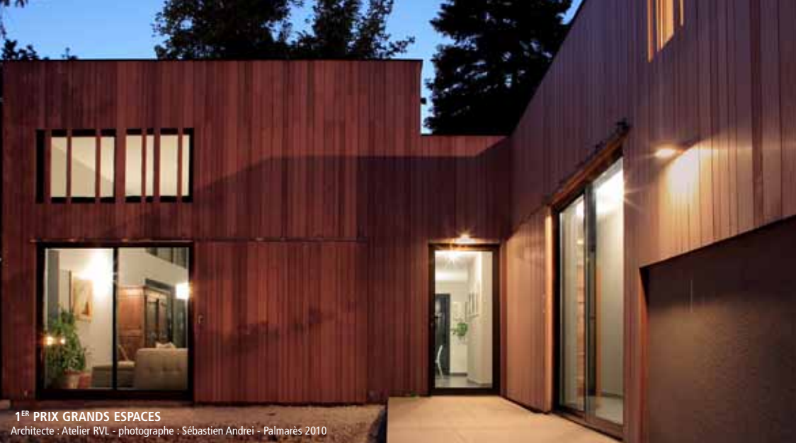
1 ER PRIX GRANDS ESPACES Architecte : Atelier RVL - Palmarès 2010